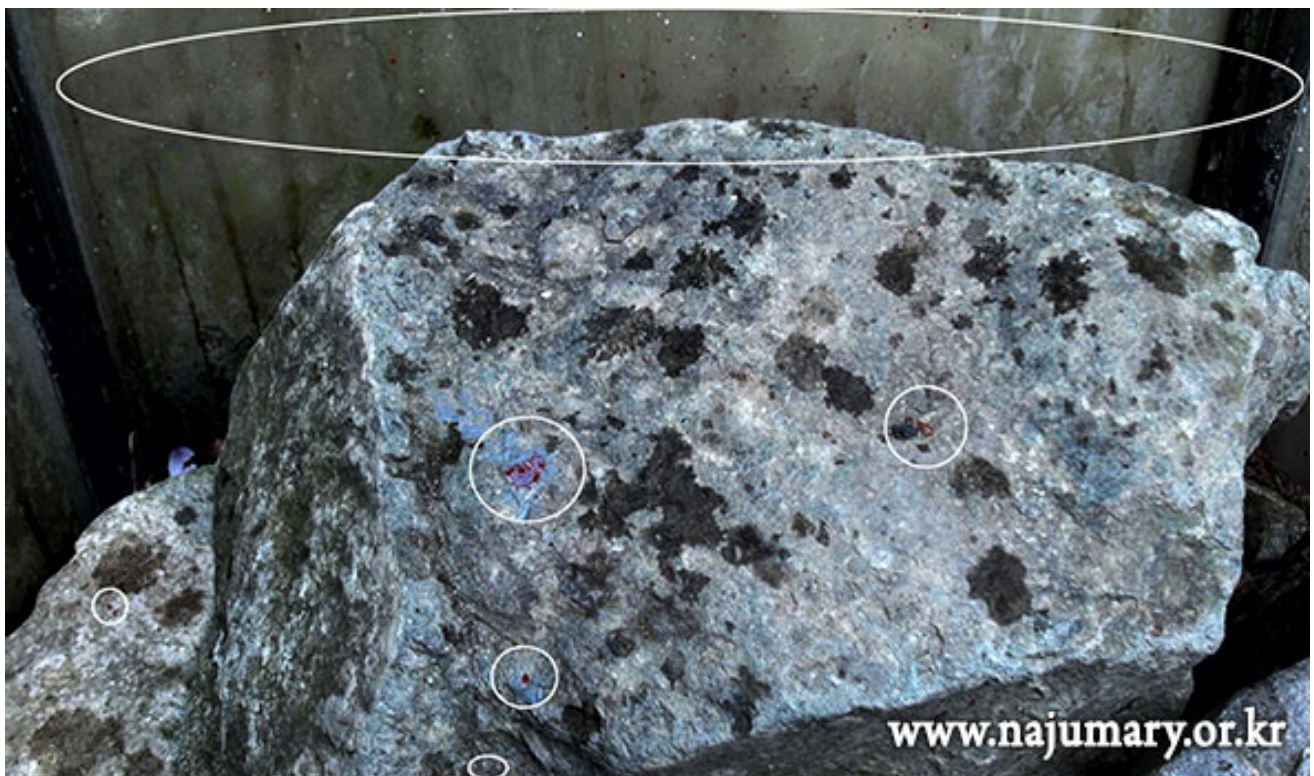
Le Précieux Sang, l'Huile parfumée puis l'épais Lait maternel, les flots de la miséricorde sont descendus quand Julia a participé aux souffrances de Jésus et a reçu les Messages sous le Crucifix sur le Mont Calvaire.